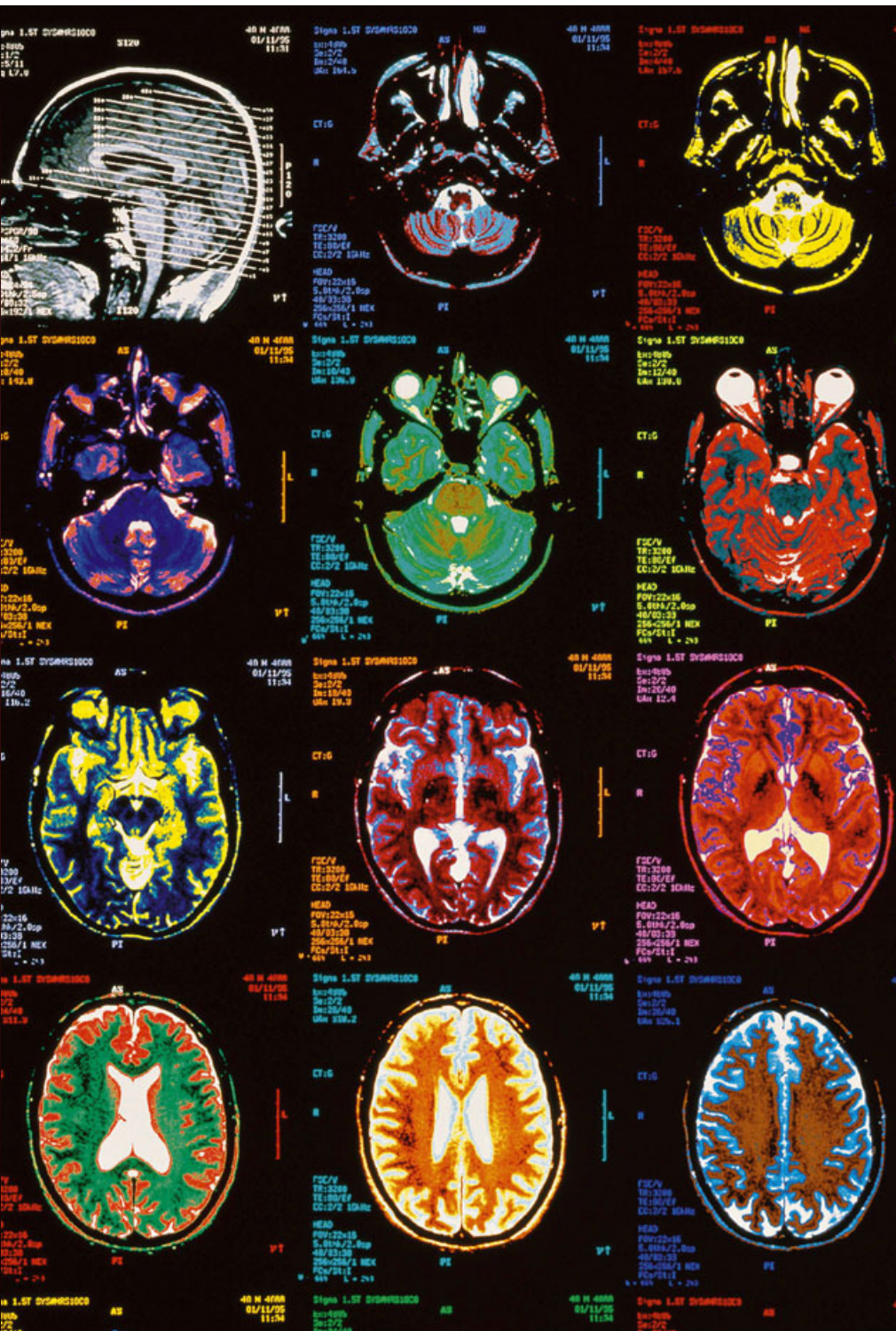
Augen der Öffentlichkeit vom Idol zur gestörten Frau